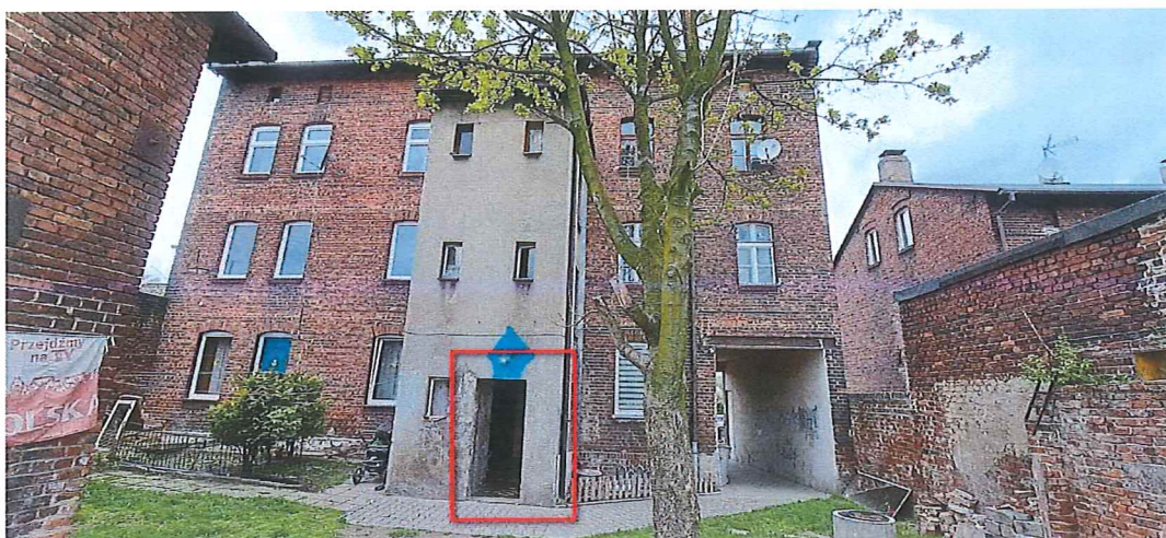
Fot. 1. Lokalizacja otworu drzwiowego na elewacji tylnej budynku.